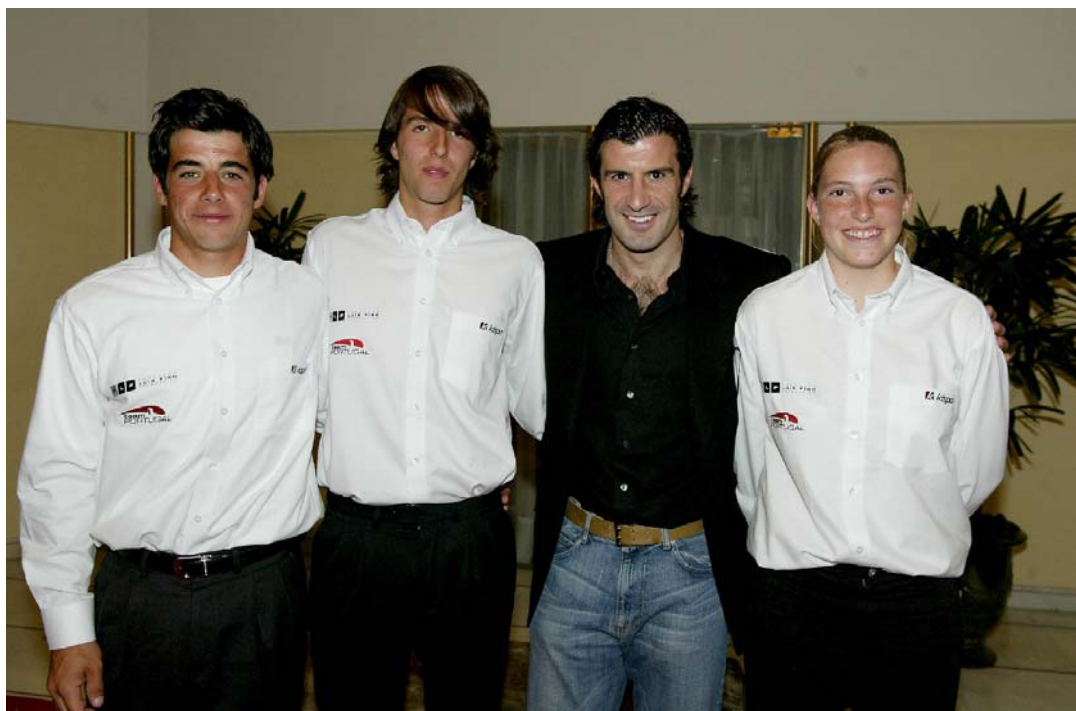
Porto, 2004/03/10 Starzone - Departamento de Comunicação Tel. 228347102 fax 228347108